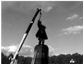
Photo : Deimantas Narkevicius, Once in the XX Century , 2004.